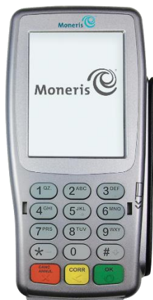
Terminal VX 820