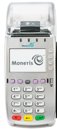
Terminal VX 520